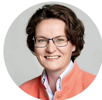
Ina Scharrenbach, Ministerin für Heimat, Kommunales, Bau und Gleichstellung des Landes Nordrhein-Westfalen